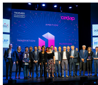
Les Trophées 2018

Les meilleurs moments des Trophées 2021, c'est par ici !