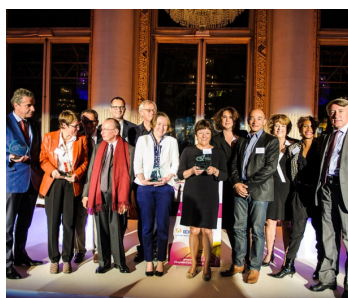
Les Trophées 2014